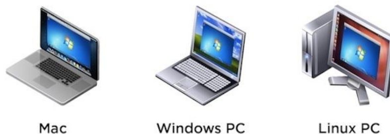
Figure 1 – Exemple de système invité Windows tournant sur des hôtes différents.

Cette technique permet, sur votre machine, dans votre système d'exploitation habituel, dit hôte , de faire tourner indépendamment un nouveau système d'exploitation différent, dit invité .