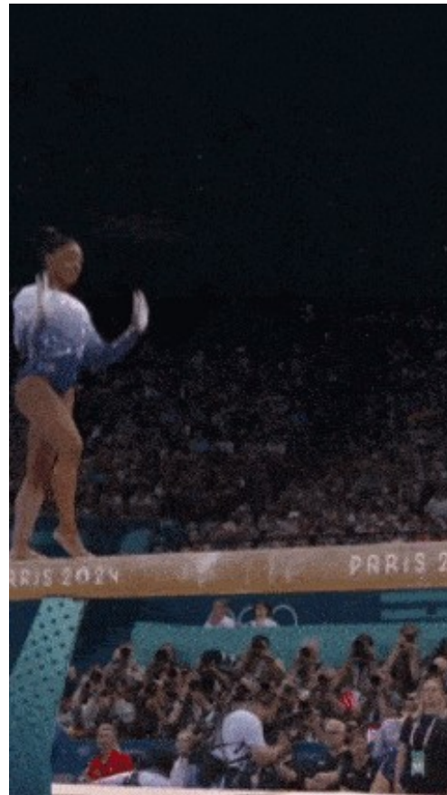
Simon Biles, Paris 2024.