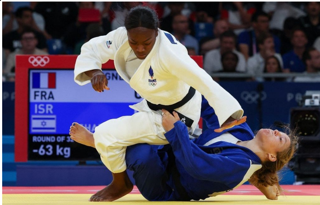
Clarisse Agbegnenou, Paris 2024.