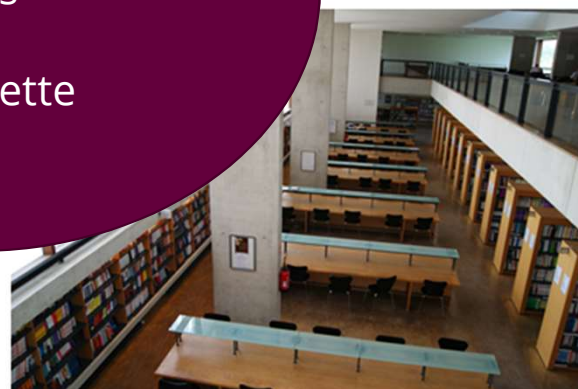
BU droit éco gestion à Sceaux.