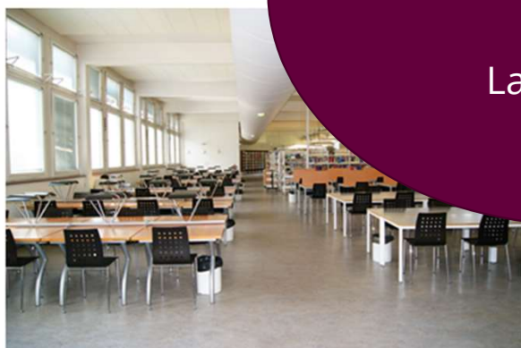
BU Sciences et STAPS à Orsay.

15 documents pour 4 semaines sur tous les sites + La navette