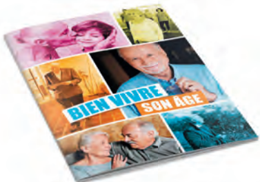
Brochure pour une avancée en âge sereine

Les caisses de retraite et Santé publique France vous aident à bien vivre votre âge _____