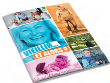
Brochure destinée aux jeunes seniors