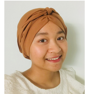
NOVIANITA Berliana Pharma M1 Paris-Saclay