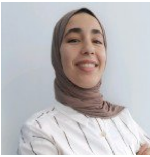
ABBAS Cylia Pharma M1 Paris-Saclay