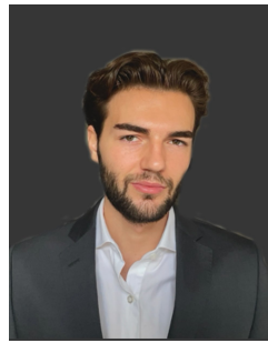
FETAHU Arton Pharma Grenoble