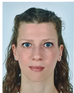
ROCHE SABIDO Violaine Pharma Barcelona