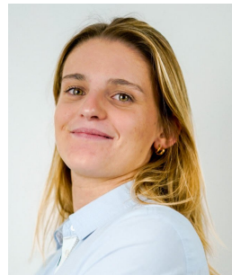
LACAILLE Victoire Pharma Aix-Marseille