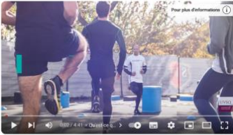
Comprendre l'importance du sport dans la santé mentale et physique